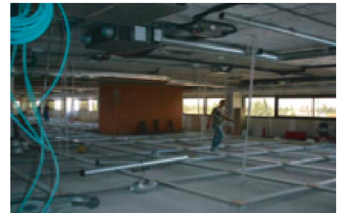
Escritório em fase de re-styling