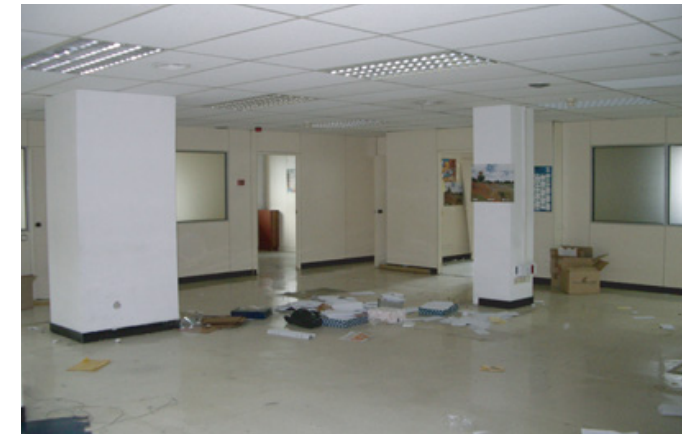
Exemplo de escritório antes do re-styling

Para o desenvolvimento deste trabalho, contamos com profissionais qualificados. A nossa empresa dispõe de arquitectos, engenheiros industriais, arquitectos técnicos, arquitectos de interiores e desenhadores.